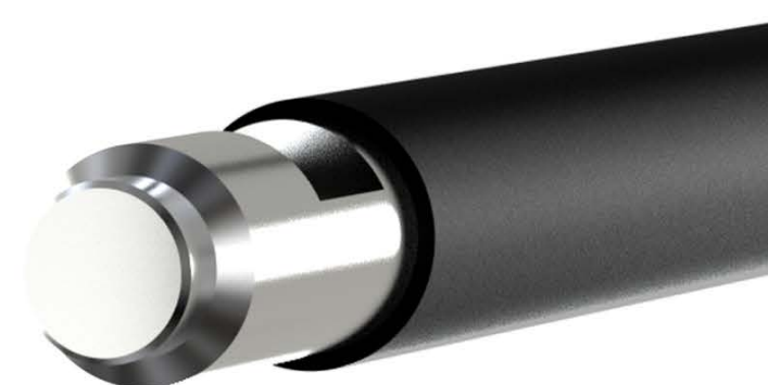
ANSE EN ACIER TREMPÉ DE 15 MM PROTECTION TPU DE 3 MM SERRURE INVIOLETTABLE