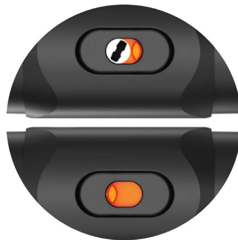
SERRURE ANTIVOL SÉCURISÉE SYSTÈME ANTI-EFFRACTION LOQUET RÉSISTANT À L'EAU ET À LA POUSSIÈRE