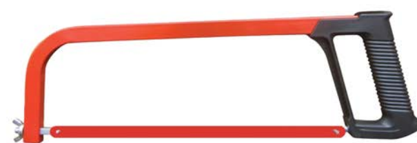
ANTIVOL SÉCURISÉ CONTRE LES SCIÉS À MÉTAUX