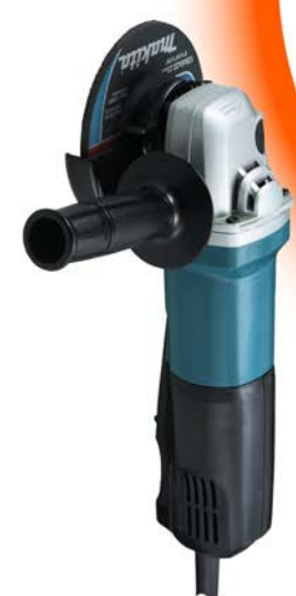
ANTIVOL SÉCURISÉ CONTRE LES MEULEUSES