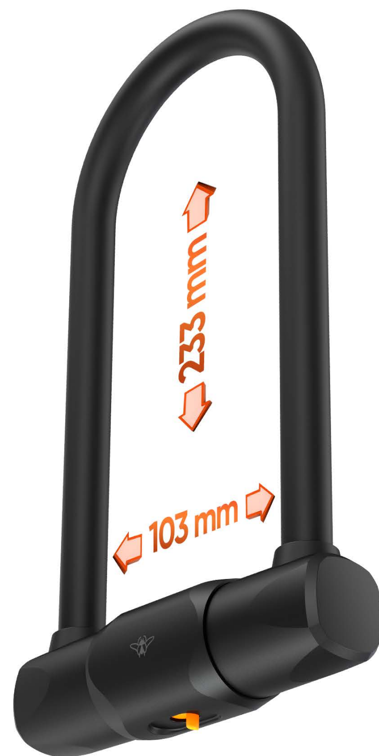
DIMENSIONS: 16,5CM X 30,2CM POIDS: 1,7 KGS