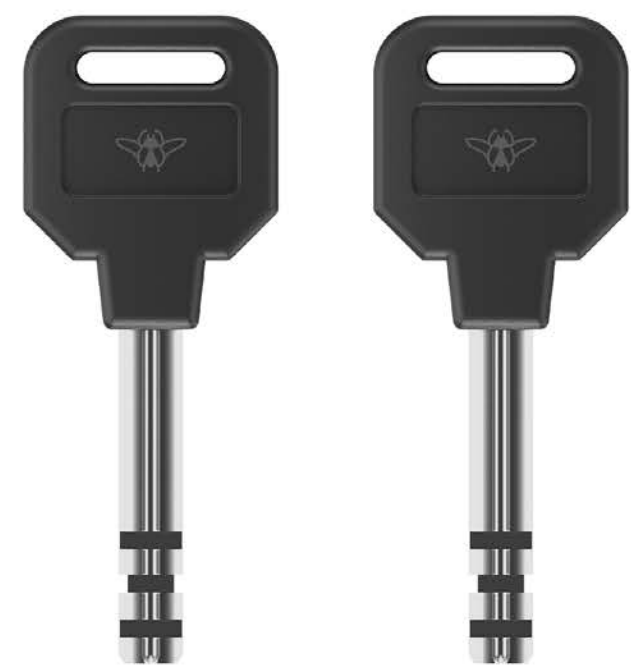
2 CLÉS EN ACIER INOXYDABLE