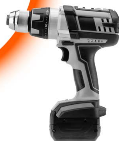
ANTIVOL SÉCURISÉ CONTRE LES PERCEUSES