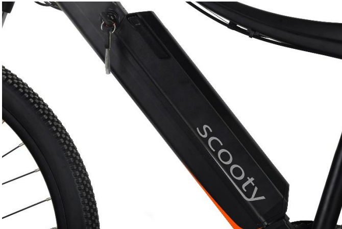
Batterie amovible avec clé