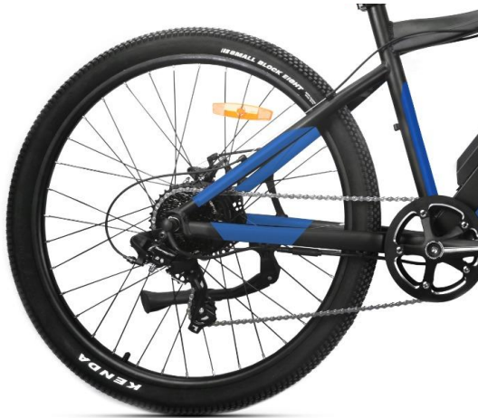
Freins à disque, 8 vitesses et béquille