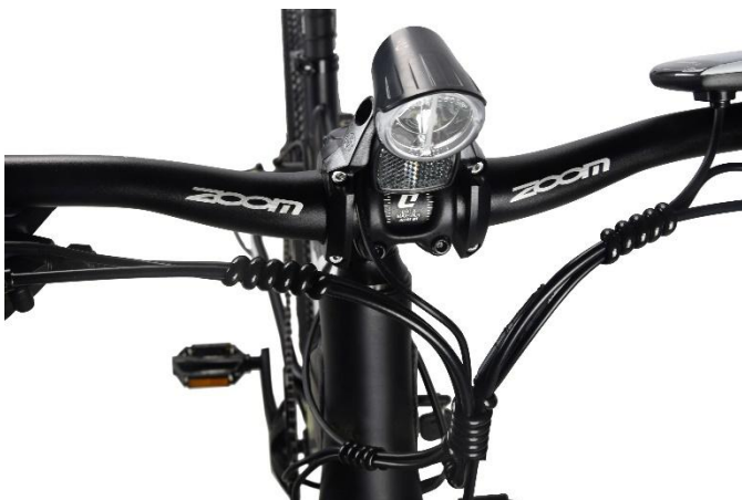
Écran, phare avant