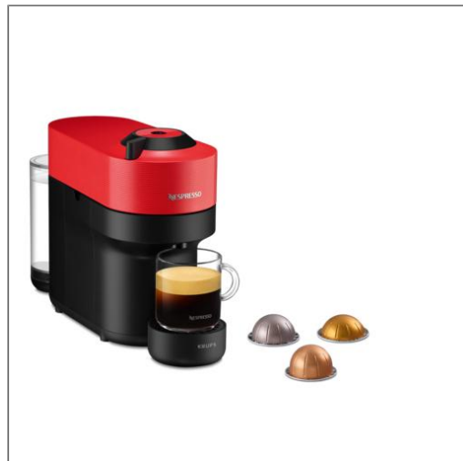
Nespresso VERTUO POP Rouge piment Nespresso YY4888FD