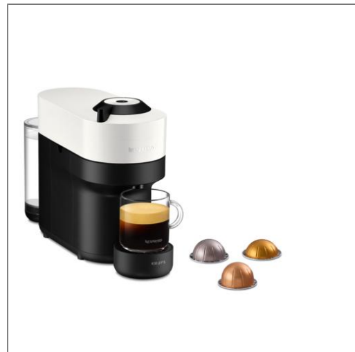
Nespresso VERTUO POP Blanc coco Nespresso YY4889FD