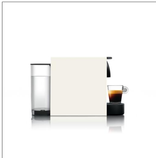
Nespresso Essenza Mini by Krups, Pure white Machine à café Nespresso YY2912FD

Toute l'expertise et la technologie Nespresso dans le modèle le plus compacte de la gamme.