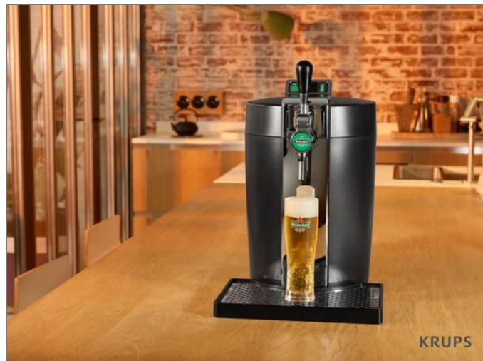
BEERTENDER NOIR ET CHROME Machine à bière YY2932FD