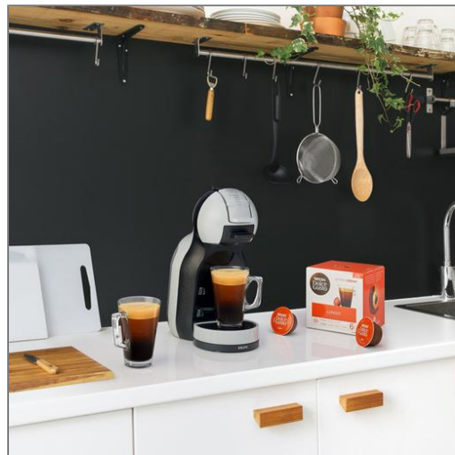
Mini Me gris artic Machine expresso Nescafé Dolce Gusto YY3888FD