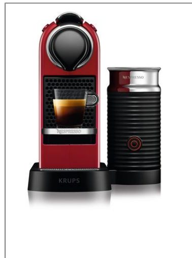
Nespresso CitiZ & Milk by Krups rouge Machine à café YY4116FD