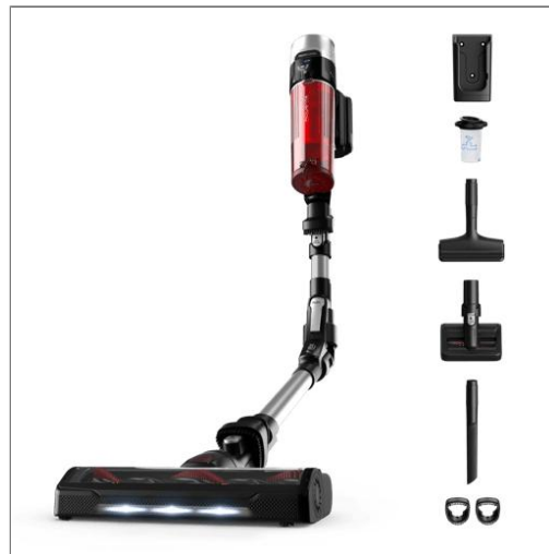
XForce Flex 9.60 Cordless Vacuum Cleaner, Animal Care Model RH2077WO