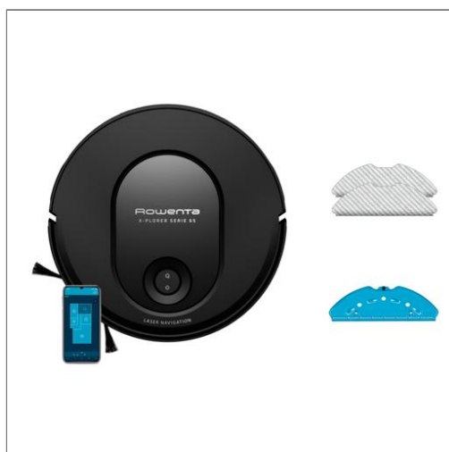
X-PLOER Serie 65, Aspirateur robot laveur, Nettoyage méthodique Aspirateur robot RR8L65WH