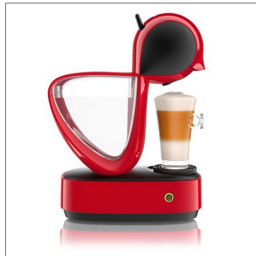
Infinissima rouge Machine expresso Nescafé Dolce Gusto KP170510