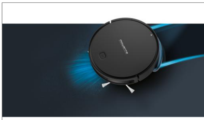
X-Plorer Serie 40 - Allergy Connect Aspirateur robot RR7245WH