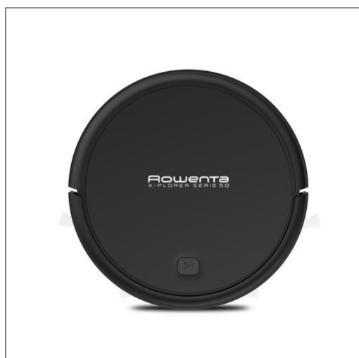
X-PLOERER SERIE 50 ALLERGY CARE Aspirateur robot RR7365WH