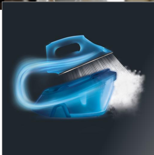
POWERSTEAM 2200 W Noir et Gris Centrale Vapeur YY5135FC