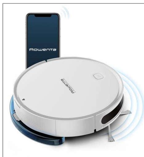
X-PLOERER SERIE 50 Aspirateur robot RR7387WH