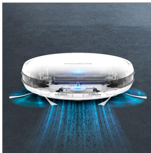
X-Plorer Série 45, Aspirateur robot, Navigation aléatoire, 150min Aspirateur robot RR8227WH