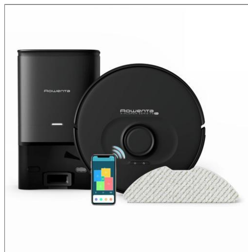
X-Plorer Série 75S+, Aspirateur robot, Navigation intelligente, 120min, station Aspirateur robot avec station de vidage RR8585WH