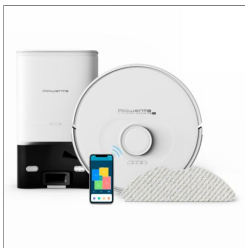
X-PLOER Serie 75 S+ Aspirateur robot avec station de vidage RR8587WH