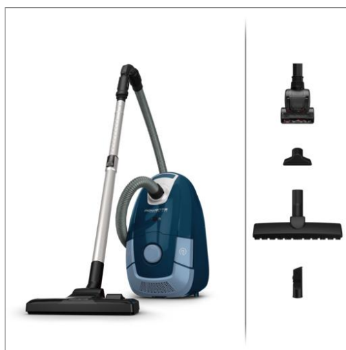
POWER XXL ANIMAL CARE Aspirateur avec sac R03172EA