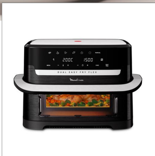
Dual Easy Fry Flex, 9L, Air fryer, Noir DUAL FLEX 9L EZ9228F0