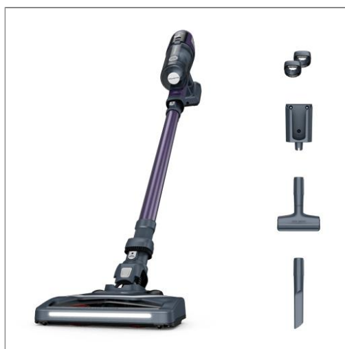
X-PERT 6.60 SMART Aspirateur balai sans fil RH6431WO