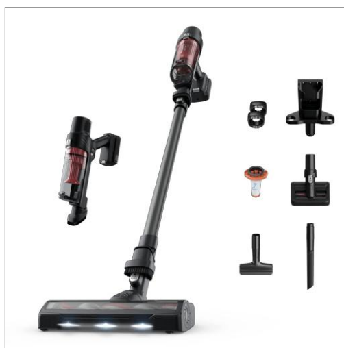
X-Pert 7.60, Aspirateur balai sans fil, 140W, Jusqu'à 45 min, Idéal poils d'animaux Aspirateur balai sans fil multifonction RH6A75WO