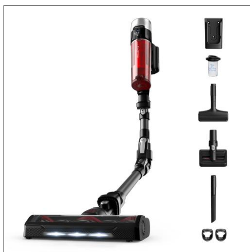
X-Force Flex 9.60, Aspirateur balai sans fil, 100AW, 45min, Animal Aspirateur balai sans fil multifonction RH2078WO