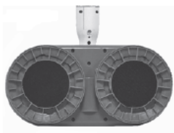
Deux têtes rotatives auto-agrippantes