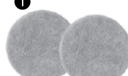
Bleu Disques de lustrage

Composition : 80% Polyester, 20% Nylon Garniture : éponge en polyuréthane