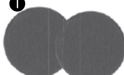
Vert foncé Disques à récurer