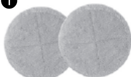
Vert clair Disques microfibres

Composition : 80% Polyester, 20% Nylon Garniture : éponge en polyuréthane