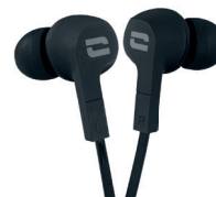
ÉCOUTEURS ÉTANCHES IPX6