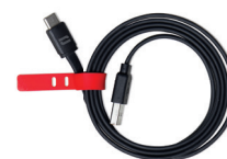
CABLE USB-A / USB-C