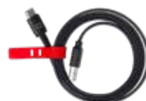
CABLE USB-A / USB-C