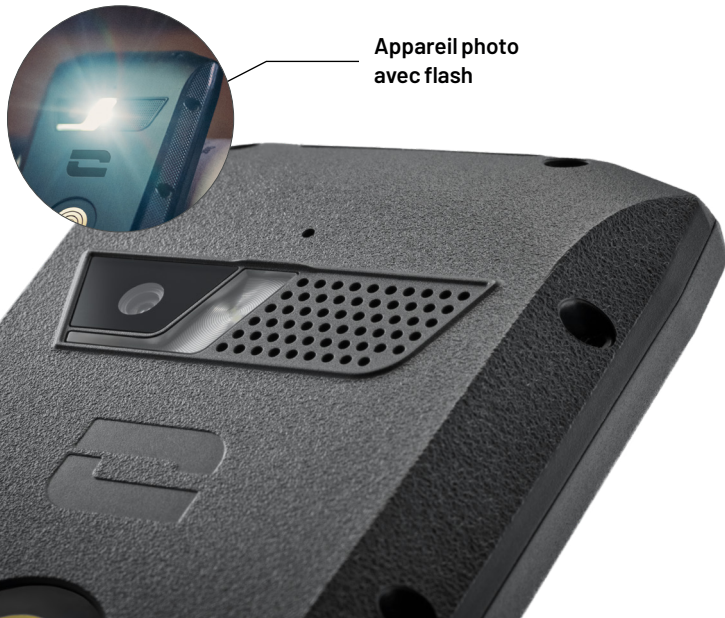
Appareil photo avec flash