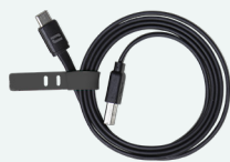
Câble USB-A / USB-C