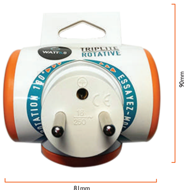
Multiprise 3 ports à tête rotative pour se brancher partout 3 ports multi-socket with rotating system to plug everywhere