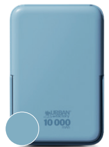
Allure blue / Bleu allure