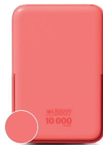
Sugar coral / Corail sucré