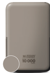
String / Corde