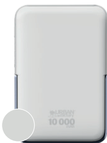
White chalk / Blanc craie