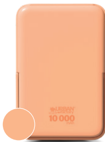
Apricot ice / Glace à l'abricot