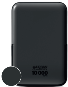
Charcoal black / Noir charbon

Charge sans fil et filaire ultra rapide Ultra-fast wireless and wired charging