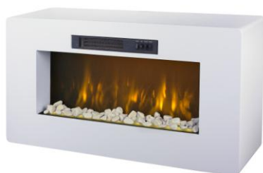
Méribel Réf 121