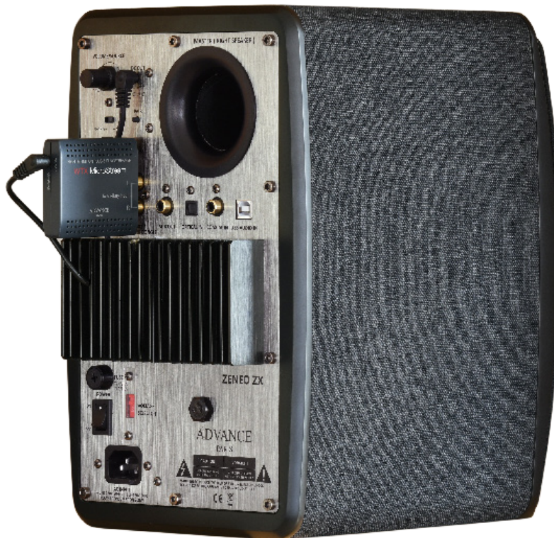
ZENEO ZX équipé du plug-in réseau WTX ZENEO ZX with WTX WIFI dongle

Les boomers sont équipés d'une membrane en papier traité avec surfaçage rigidifiant afin d'obtenir un son neutre et vivant. Les bobines mobiles en cuivre pur sont câblées sur support capton. Pour éviter toute agressivité et améliorer la douceur, les tweeters ont des membranes en tissu imprégné et les bobines mobiles sont refroidies dans du ferrofluide.