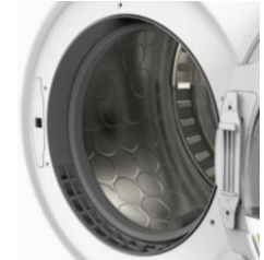
Tambour inox Soft Drum™