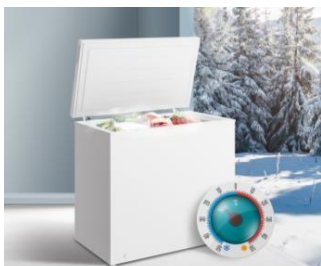
Compatible température ambiante jusqu'à -15°C

Cet appareil continue de fonctionner parfaitement dans un environnement ambiant allant jusqu'à -15°C.