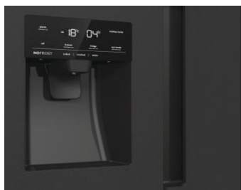
Distributeur d'eau, glaçons et glace pilée relié à l'eau courante

De l'eau fraîche à tout moment de la journée grâce au réservoir non relié à l'arrivée d'eau. Aucune perte d'espace, installation rapide et facile. Il est dorénavant possible de bénéficier des avantages d'un réfrigérateur Américain sans les inconvénients !