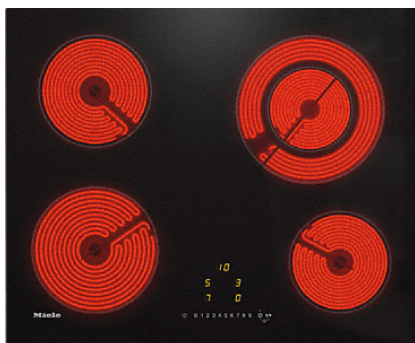
Table de cuisson vitrocéramique avec 4 zones de cuisson pour un maximum de confort