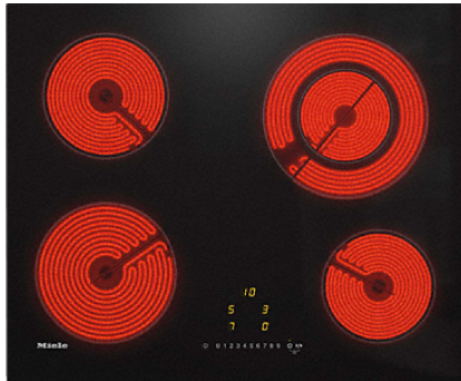
Table de cuisson vitrocéramique avec 4 zones de cuisson pour un maximum de confort