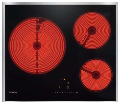
Table de cuisson vitrocéramique avec 3 zones de cuisson pour plus de confort .