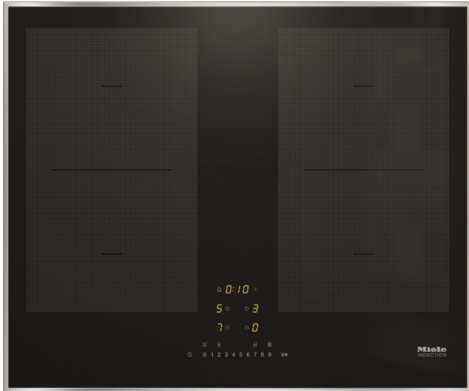
TABLE DE CUISSON KM 7465 FR