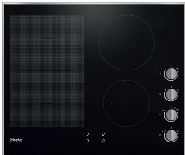
TABLE DE CUISSON KM 7164 FR