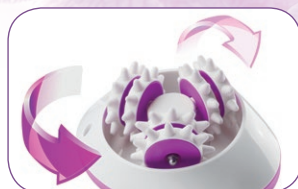
3 x 2 rotierende Massagerollen