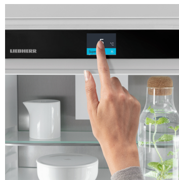
Écran Touch & Swipe

Grâce à deux circuits de réfrigération complètement séparés, le système DuoCooling garantit qu'aucun échange d'air n'a lieu entre les parties réfrigération et congélation. Les aliments restent ainsi croquants et les odeurs ne se propagent pas. Cela signifie moins de gaspillage et des courses moins fréquentes pour plus d'économies et de plaisir.