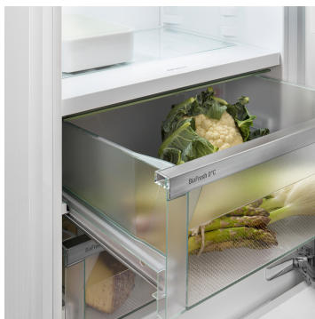
Compartiment Fruit & Vegetable

Grâce à deux circuits de réfrigération complètement séparés, le système DuoCooling garantit qu'aucun échange d'air n'a lieu entre les parties réfrigération et congélation. Les aliments restent ainsi croquants et les odeurs ne se propagent pas. Cela signifie moins de gaspillage et des courses moins fréquentes pour plus d'économies et de plaisir.