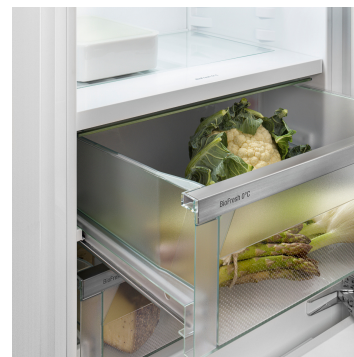
Compartiment Fruit & Vegetable

Grâce à deux circuits de réfrigération complètement séparés, le système DuoCooling garantit qu'aucun échange d'air n'a lieu entre les parties réfrigération et congélation. Les aliments restent ainsi croquants et les odeurs ne se propagent pas. Cela signifie moins de gaspillage et des courses moins fréquentes pour plus d'économies et de plaisir.