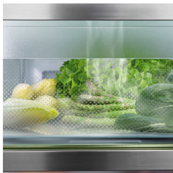
BioFresh avec HydroBreeze

Vous souhaitez disposer d'un refroidissement professionnel de vos fruits et légumes ? HydroBreeze saura vous inspirer : la brume fraîche, combinée à la température du compartiment à peine supérieure à 0 °C, donne aux aliments le coup de pouce supplémentaire pour une plus longue durée de conservation. L'effet visuel est également impressionnant. HydroBreeze est automatiquement activé pendant 4 secondes toutes les 90 minutes et pendant 8 secondes lorsque la porte est