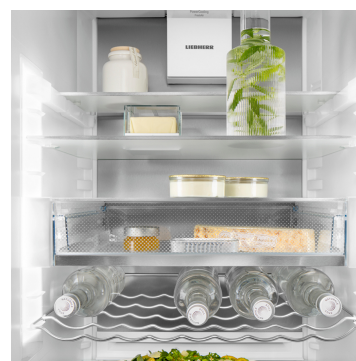
Paroi arrière SmartSteel

Grâce à la surface SmartSteel, le design épuré de cet appareil s'intègre à merveille à n'importe quelle cuisine. La finition à effet horizontal met en valeur l'acier inoxydable et lui confère une brillance soyeuse et un toucher très agréable. Le revêtement spécial minimise les traces de doigts et protège la surface contre les rayures. Résultat : une esthétique toujours parfaite.