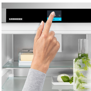
Écran Touch & Swipe

Profitez d'un intérieur éclairé de façon optimale. La LightTower présente les aliments sous leur meilleur jour et est placée de sorte à toujours éclairer votre réfrigérateur de manière optimale sur la plus grande surface possible. La LightTower directement intégrée aux parois latérales laisse également plus de place pour vos aliments.