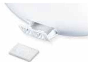
Utilisation possible avec les huiles essentielles (15 cousinets aroma inclus)