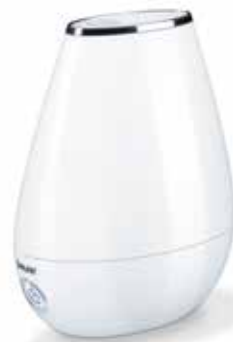
Mode nuit: très silencieux et bouton non éclairé