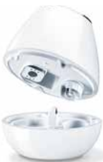
Réservoir d'eau amovible de 2 litres