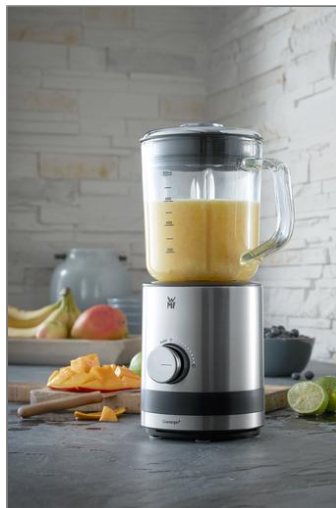
KITCHENminis Blender 0.8 L 0416490011