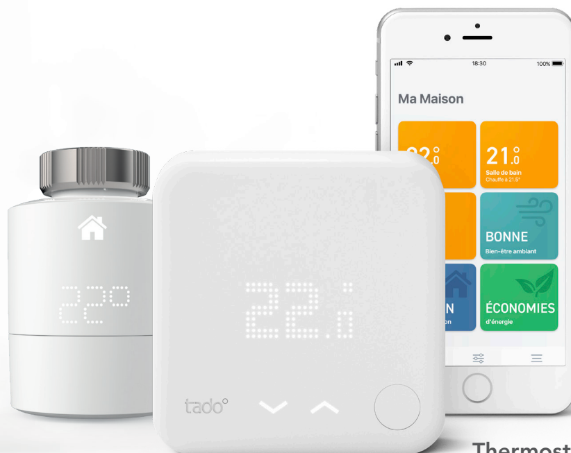
Thermostats Intelligents V3+