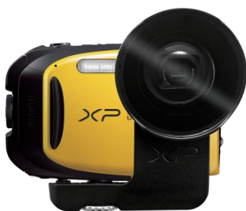
réf. 11499 Convertisseur grand-angle ACL-XP70 « Action Camera » (18mm équiv.)