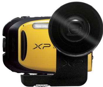
Face avec ACL-XP70 complément optique 18mm (équivalent)