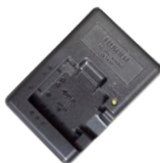
réf. 11438 Chargeur BC-45W