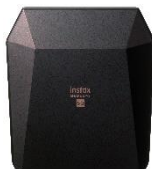
INSTAX SHARE SP-3