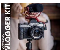
VLOGGER KIT 899€