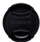
Bouchon d'objectif FLCP-77 II