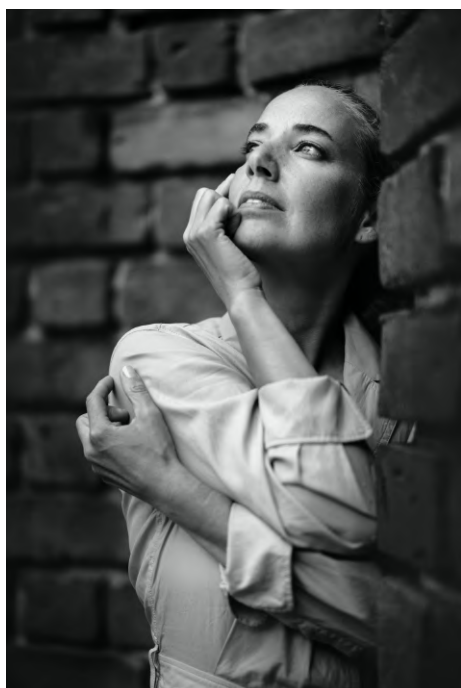
X-T4 + XF 50mm F1.0 - F1.0 1/1900 Sec - Iso320

Le XF 50mm F1.0 R WR est un téléobjectif ultra lumineux d'une focale de 50mm (équivalente à 76mm en format 35mm) et d'ouverture maximale F1,0. Il bénéficie d'un pouvoir séparateur incomparable et, grâce au grand diamètre de ses lentilles, cet objectif est le plus rapide jamais produit par Fujifilm. Son magnifique bokeh produit des arrière-plans délicats et progressifs. Aux plus hautes valeurs de diaphragme, la parfaite netteté de l'ensemble du champ ajoute à sa polyvalence, l'orientant vers la réalisation d'images de styles très divers.