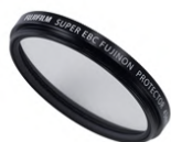
Filtre de protection PRF-77